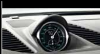
Design-Zitat: Bis 1967 war die Ziffern- und Skalenfarbe der Instrumente grün und die Zeiger weiß.

Schon von außen ist die klassische 911 DNA unverkennbar: z. B. an den rund ausgeformten Scheinwerfern und den Lufteinlasslamellen. Im Jubiläumsmodell sind sie zusätzlich mit Chrom akzentuiert, genau wie das Heckdeckelgitter hinten. Es verrät, wo der Motor sitzt: Sechs Zylinder, in Boxeranordnung, inklusive typischem Porsche Sound. So weit die Tradition. Doch kommen wir zur Zukunft: Denn mit dem Motor des Porsche 911 Carrera S bewegt sich das Jubiläumsmodell eindeutig auf dem neuesten Stand der Zeit. Mit 3,8 Litern Hubraum entwickelt der Motor eine beeindruckende Leistung von 294 kW (400 PS). So beschleunigt das