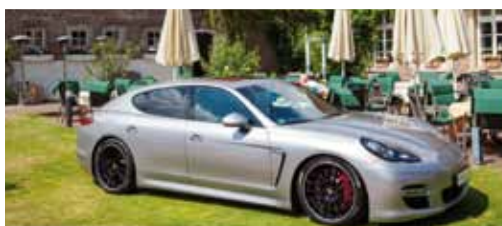
Porsche und Golf. Leidenschaft inbegriffen.