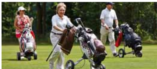
Gemeinsamer Spaß am Golfen.