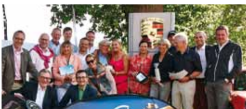
Die glücklichen Gesamtsieger.