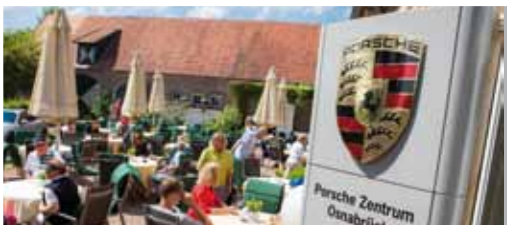
Gemütliche Atmosphäre beim Golfturnier