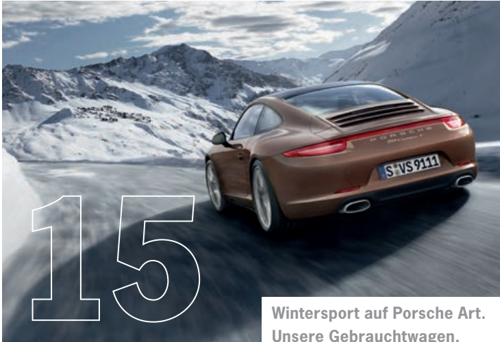
Wintersport auf Porsche Art. Unsere Gebrauchtwagen.