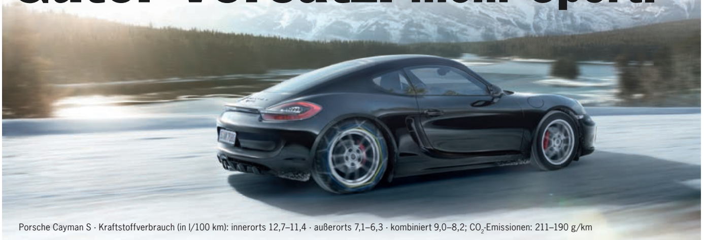
Porsche Cayman S · Kraftstoffverbrauch (in l/100 km): innerorts 12,7–11,4 · außerorts 7,1–6,3 · kombiniert 9,0–8,2; CO 2 -Emissionen: 211–190 g/km