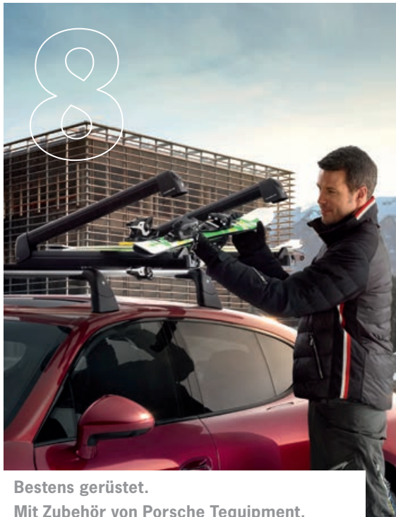
Bestens gerüstet. Mit Zubehör von Porsche Tequipment.