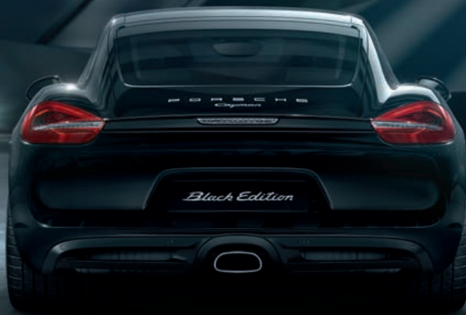
Cayman Black Edition. Objekt der Begierde.

Porsche Times erscheint beim Porsche Zentrum Osnabrück, PZ Sportwagenzentrum Osnabrück GmbH & Co. KG, Blumenhaller Weg 153, 49078 Osnabrück, Tel.: +49 541 40441-500, Fax: +49 541 40441-551, E-Mail: info@porsche-osnabrueck.de, www.porsche-osnabrueck.de; Auflage: 2.008 Stück. Redaktionsanschrift: Porsche Zentrum Osnabrück, PZ Sportwagenzentrum Osnabrück GmbH & Co. KG, Blumenhaller Weg 153, 49078 Osnabrück. Für unverlangt eingesandte Fotos und Manuskripte wird keine Haftung übernommen. Die Verantwortung für die redaktionellen Inhalte und Bilder dieser Ausgabe übernimmt das Porsche Zentrum. Ausgenommen davon sind die offiziellen Seiten der Porsche Deutschland GmbH.