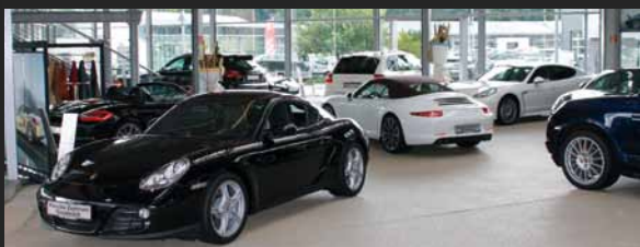
Showroom vor dem Umbau im Oktober 2012.

Wir bauen um und vergrößern unser Porsche Zentrum Osnabrück. Damit wir zukünftigen Anforderungen, wie zum Beispiel der geplanten Erweiterung der Porsche Modellpalette, gerecht werden können, hat die Inhaber-Familie Starke entschieden, in eine Erweiterung des Porsche Zentrum Osnabrück zu investieren.