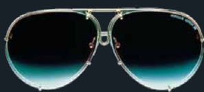
Exklusivbrille von 1978