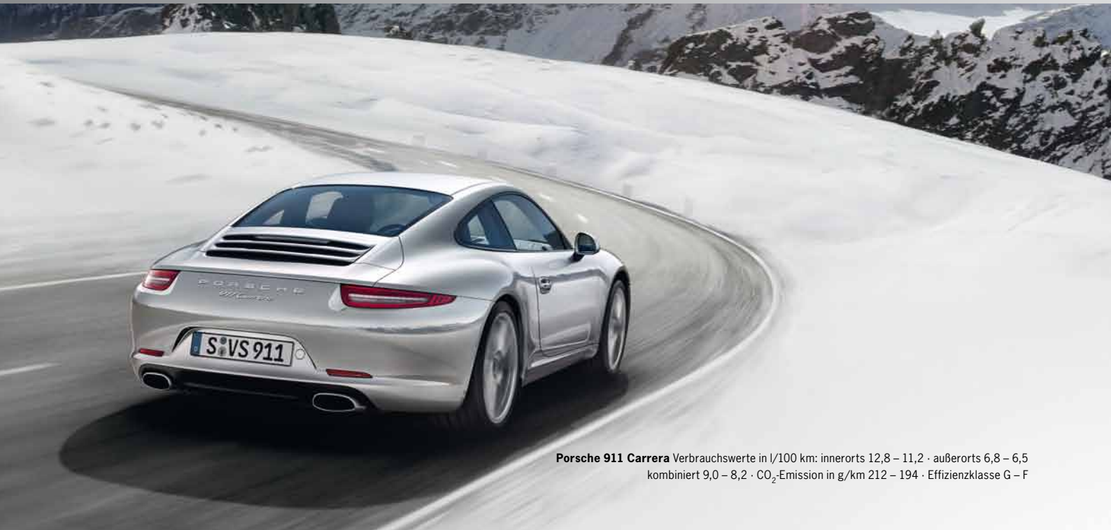
Porsche 911 Carrera Verbrauchswerte in l/100 km: innerorts 12,8 – 11,2 · außerorts 6,8 – 6,5 kombiniert 9,0 – 8,2 · CO 2 -Emission in g/km 212 – 194 · Effizienzklasse G – F