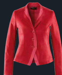
RawTec Blazer von 2011