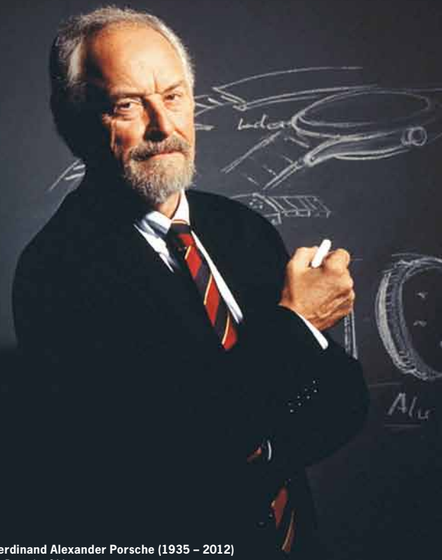
Professor Ferdinand Alexander Porsche (1935 – 2012) Gestalter des Porsche 911 Gründer des Porsche Design Studio Kreateur der Luxusmarke Porsche Design

In den folgenden Jahrzehnten entstanden für die eigene Marke Porsche Design zahlreiche Designklassiker sowie exklusive Accessoires. Daneben entwickelte das Studio für international bekannte Auftraggeber unter der Marke „Design by F.A. Porsche“ eine Vielzahl an Industrieprodukten, Haushaltsgeräte und Gebrauchsgütern. Alle Entwürfe haben eines gemeinsam: innovative Technologie, sorgfältige Materialauswahl und hochwertige Verarbeitung. Dabei verbindet sich handwerkliche Tradition mit zukunftsweisenden Ideen. Ein Erfolgskonzept, das den Zeitgeist trifft – damals und heute. Das Porsche Design Studio gilt als eines der renommiertesten Designhäuser Europas.