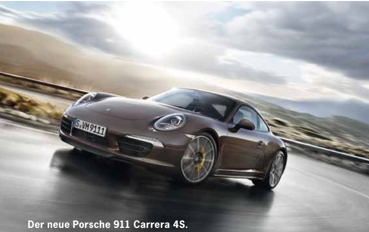
Der neue Porsche 911 Carrera 4S.