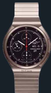
Titanium Chronograph von 1980